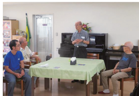
写真二枚で、語る北野校長、拝聴する後援会会員の様子をご覧ください。